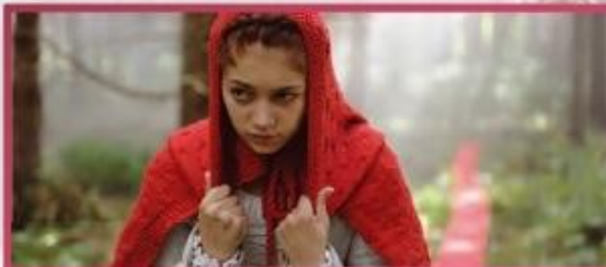
Und für das Märchen von Rottkäppchen fehlt ihr nur eine wirklich, wirklich rote Mütze...