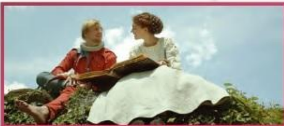
Prinzessin Clara hat eine tolle Idee!

Es war einmal eine Prinzessin... so beginnt auch dieses Märchen, das eigentlich gar keines ist. Die Prinzessin lebt nämlich in einem so kleinen und so unbedeutenden Königreich, dass sie einfach in keinem Märchen vorkommt. Dabei möchte Prinzessin Clara unbedingt so berühmt sein wie Dornröschen oder so beliebt wie Rapunzel. Nur, was muss man dafür tun? 100 Jahre schlafen? Sich mit dem bösen Wolf anlegen? An Ideen mangelt es der Prinzessin jedenfalls nicht. Und so begibt sie sich mit ihrem besten Freund, dem Hofnarren Michel, in ihr erstes großes Märchenabenteuer.