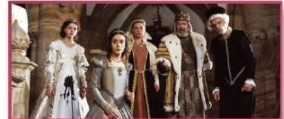
Was wird wohl die königliche Familie von Claras Ideen halten?

Es war einmal eine Prinzessin... so beginnt auch dieses Märchen, das eigentlich gar keines ist. Die Prinzessin lebt nämlich in einem so kleinen und so unbedeutenden Königreich, dass sie einfach in keinem Märchen vorkommt. Dabei möchte Prinzessin Clara unbedingt so berühmt sein wie Dornröschen oder so beliebt wie Rapunzel. Nur, was muss man dafür tun? 100 Jahre schlafen? Sich mit dem bösen Wolf anlegen? An Ideen mangelt es der Prinzessin jedenfalls nicht. Und so begibt sie sich mit ihrem besten Freund, dem Hofnarren Michel, in ihr erstes großes Märchenabenteuer.